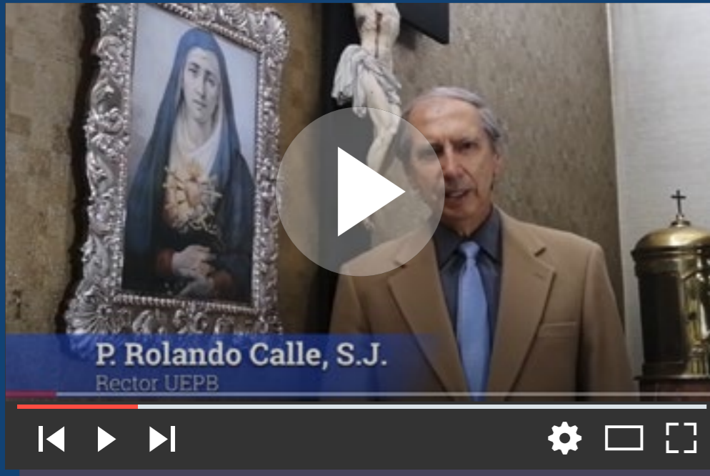
Acompañamiento de Bienestar Estudiantil